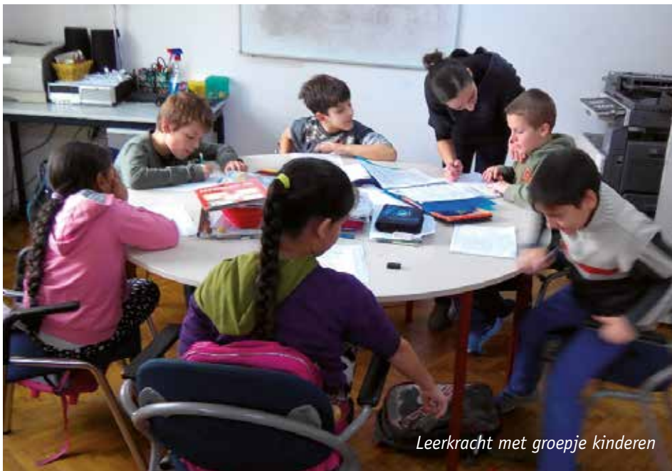
Leerkracht met groepje kinderen

Vorig jaar heeft de Rehobothschool in Geldermalsen besloten om jaarlijks het zendingsgeld in de derde periode van het schooljaar aan een wisselend doel te besteden. Vanaf 20 maart sparen de kinderen het zendingsgeld voor Stichting OGO. Het geld is bestemd voor de allerarmsten in Oekraïne. Onder andere voor (Bijbels-)onderwijs aan kinderen met syndroom van Down en zigeunerkinderen, Roma-kleuters. We zijn benieuwd naar de opbrengst!