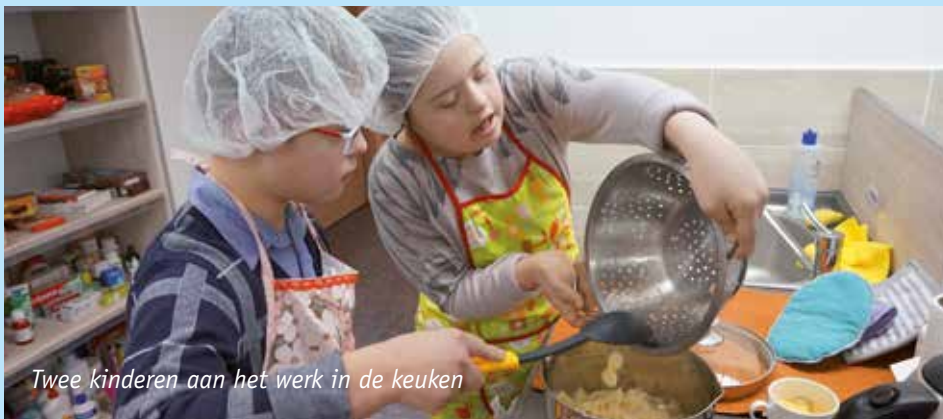
Twee kinderen aan het werk in de keuken

Er zijn weer goede ontwikkelingen te melden over het onderwijsproject voor kinderen met een downsyndroom. Er doen nu 21 kinderen aan het project mee en zij leren steeds meer om zelfstandig allerlei taken aan te kunnen, maar ook om op een goede manier samen te werken met anderen.