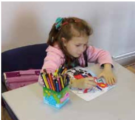
Huiswerk maken in de voormalige pastorie

met de kerkenraad een paar jaar geleden besloten om een groep meest kwetsbare kinderen zelf na schooltijd op te vangen. Hiervoor hebben ze hun pastorie verlaten en zijn verhuisd naar een kleiner huis er pal naast. In de pastorie worden nu dagelijks 35 kinderen na schooltijd opgevangen. Ze krijgen eten, horen Bijbelverhalen en krijgen begeleiding bij hun huiswerk door twee onderwijzeressen (oud-studenten van de christelijke pabo in Tirgu Mures).