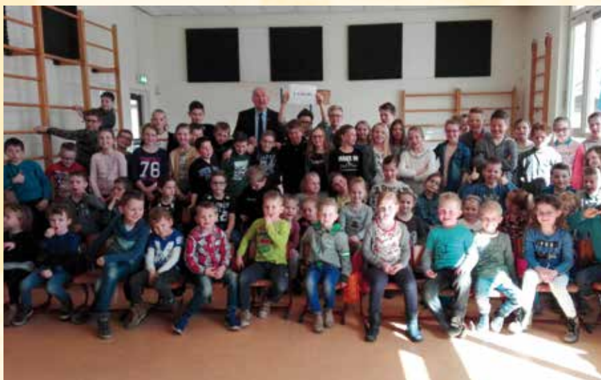
Trotse leerlingen presenteren de opbrengst van hun actie voor OGO

De Nederwoud Christelijke Basisschool in Lunteren heeft een actie gevoerd voor kinderen met het syndroom van Down in de Oekraïne. Ze hebben stroopwafels verkocht en de netto opbrengst was het mooie bedrag van ruim € 1195,-. Hartelijk dank!