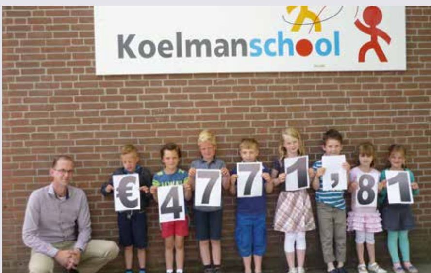
Wat een prachtige opbrengst van deze schoolactie!

Op woensdag 11 mei was de afsluiting van de actie. De juf had een mooie presentatie gemaakt met de resultaten per klas. Alles bij elkaar leverde dit een