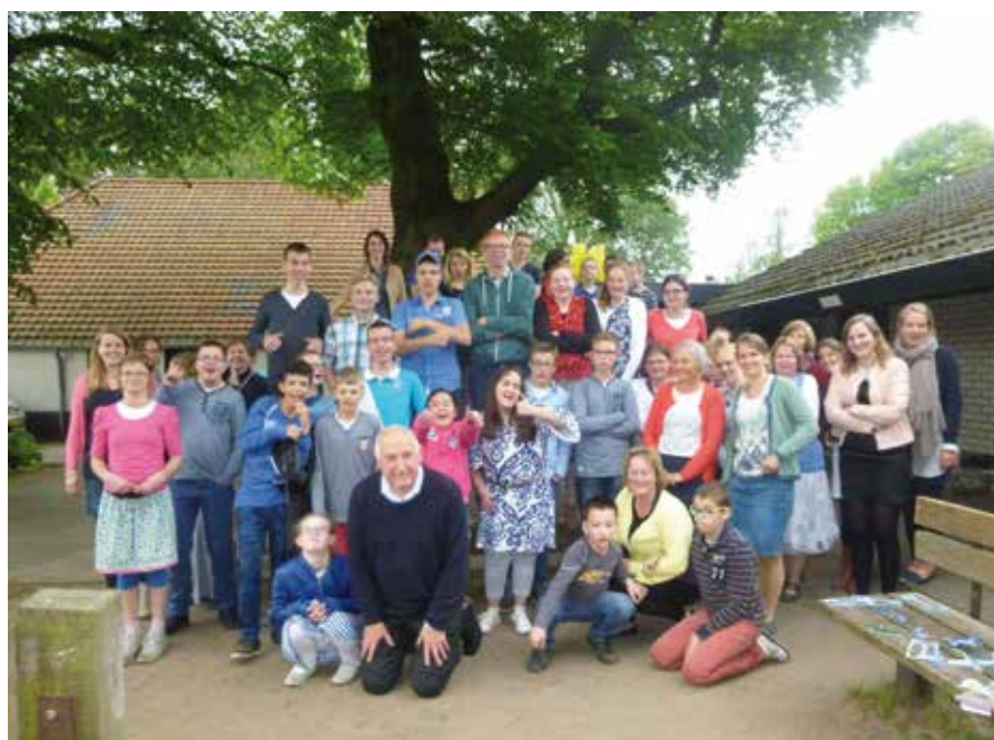
Een warm hart voor kinderen met Downsyndroom in Oekraïne.

Op 18 mei werden we hartelijk verwelkomd op een vakantiecamp van verstandelijk gehandicapten van de Samuëlschool te Gouda. Zij leefden heel erg mee met de presentatie over de kinderen met het syndroom van