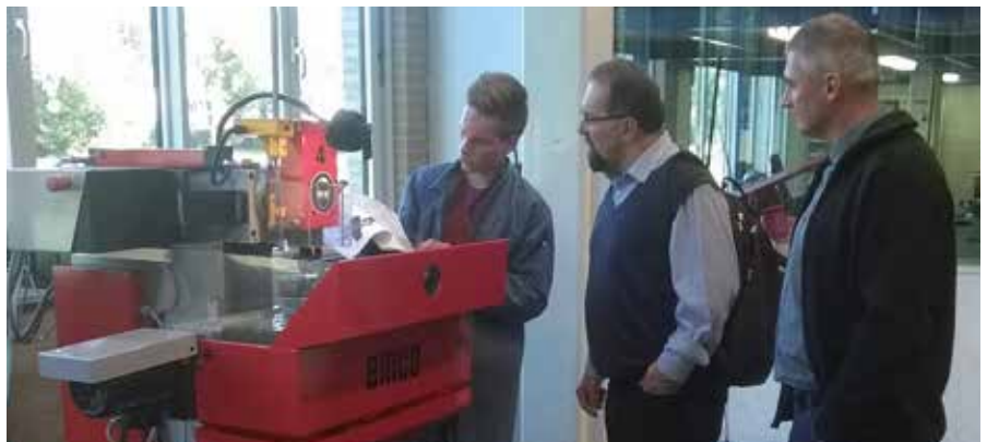
Hongaarse directeuren kijken bij een leerling die gemotiveerd aan het werk is

Amersfoort. Ook hier werd men zeer hartelijk ontvangen, de Hongaarse vlag was zelfs aangeschaft en de enige Hongaarse leerling in Hoevelaken werd opgetrommeld om met de gasten te spreken. De bezoeken van de lessen in de praktijklokalen en de gesprekken waren verrijkend. Het is altijd weer bijzonder om bij deze bezoeken ook de Bijbel te kunnen openen. We verstaan elkaar omdat we op hetzelfde fundament mogen staan. Bij het afsluiten van het bezoek aan het Hoornbeek College zongen de Hongaren ons spontaan psalm 42 in het Hongaars toe. Dit geslaagde bezoek was vooral bedoeld om te zien hoe wij elkaar kunnen versterken. Dat kan door de bij ons afgeschreven machines naar hun scholen te verplaatsen voor een tweede leven. Het kan ook door middel van uitwisseling van docenten, leerlingen en leerprogramma's. En niet in de laatste plaats door gesprekken en richtlijnen hoe we onze jongeren voorbereiden op een plaats in een maatschappij waar christelijke jongeren zich steeds eenzamer gaan voelen, daar in Oost-Europa en hier in Nederland. Stichting OGO helpt. Helpt u ook mee?