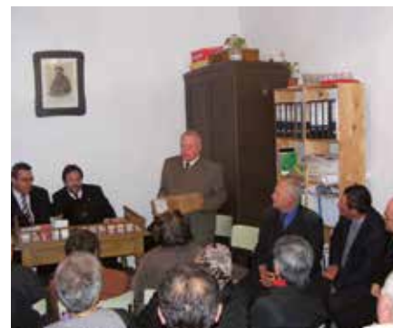
De ontvangen Bijbels worden uitgedeeld.