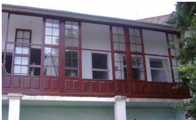
Het gebouw van de hogeschool in Tirgu Mures

gestart om ze aan woonruimte te helpen, zodat ze hun tijd aan studeren en niet aan reizen kunnen besteden. Ook gaan pabo-studenten huiswerkbegeleiding verzorgen voor kinderen waarvan de ouders dat zelf niet kunnen. Op den duur wordt huiswerkbegeleiding daarmee onderdeel van het opleidingsprogramma. Iedereen is daarmee geholpen!