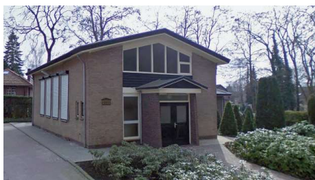
De Oud Gereformeerde Gemeente te Ermelo

Als afsluiting van het catechisatie seizoen bij de Oud Gereformeerde Gemeente te Ermelo heeft Wim de Jong voorlichting gegeven over het werk van de OGO. Wim ging met het prachtige bedrag van € 1.155,00 naar huis! Het geld zal worden overgemaakt naar de christelijke school te Izmajil. Het schoolgeld op de christelijke basisschool Stezhynka in Izmajil bedraagt 80 euro per maand. Geen van de ouders kan dat hele bedrag echter betalen. Ouders kunnen hooguit 60 euro per maand opbrengen. Sommigen zelfs niet meer dan 5 euro per maand.