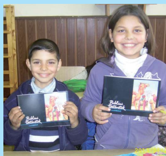
Een jongen en een meisje laten blij hun gekregen boekjes zien